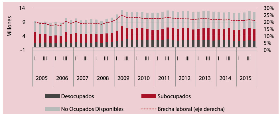
Figura 3 México: Brecha laboral, 2005.I-2015.IV